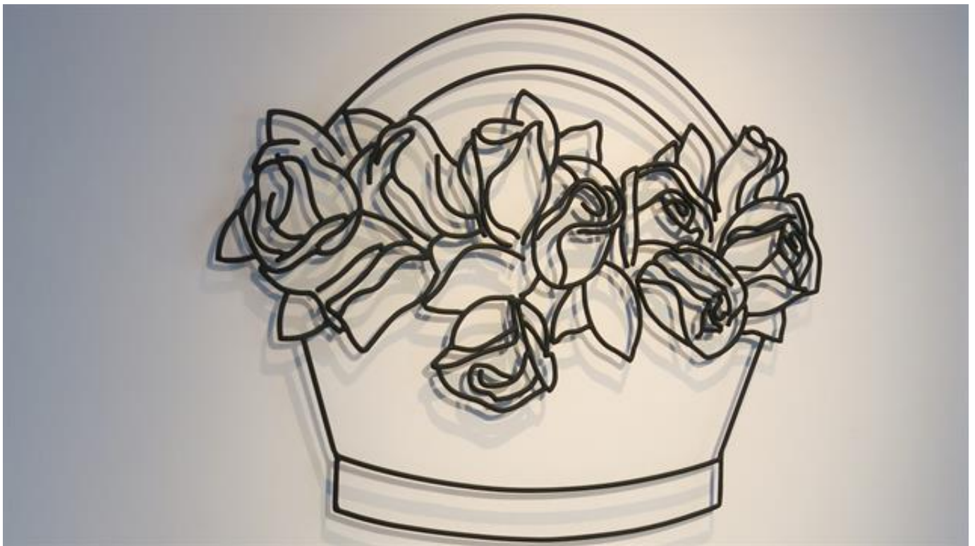
Cesta con rosas, hierro, 2017.

En la galería de la calle Libertad, ocho neones coloridos con la leyenda "Somos" y Cesta con rosas , la primera escultura de hierro hecha por el artista, alternan con el icono de una revista estadounidense, donde dos figuras portan fusiles a la manera de las Panteras Negras. Sería un error creer que en los años 70 la lucha armada sólo existía en la Argentina, tanto como suponer que los derechos sociales de los que hoy gozamos cayeron del cielo.