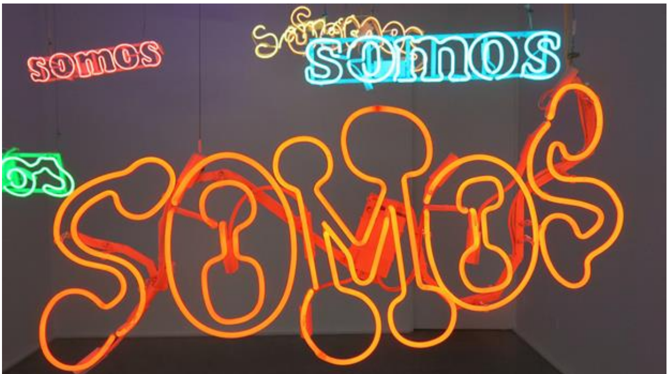
Vista de sala de la exposición Somos.