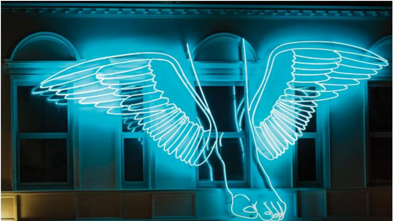
Hermes, el mensajero, en la fachada de la Fundación Telefónica.